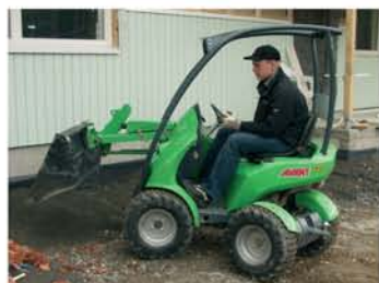
باکت های معمولی و مواد سبک