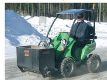
شن یا نمک پاش