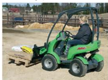
شاخک حمل پالت