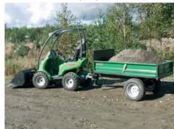
تریلر با قابلیت تخلیه (کمپرسی)