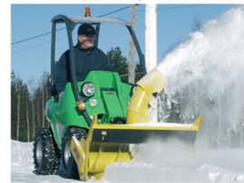
برف پاش (برف خور)