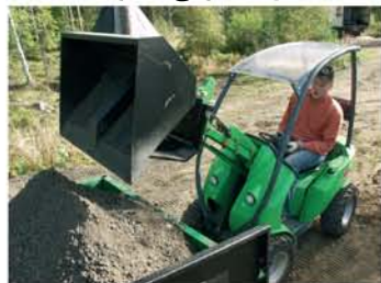
باکت بالا ریز