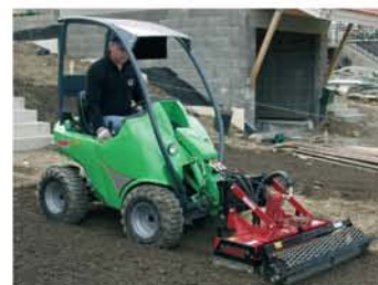
ماشین تسطیح دوار