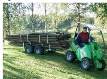
تریلر حمل درخت